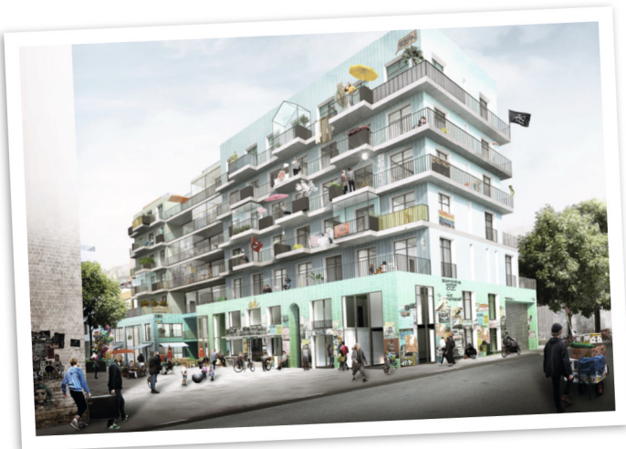
Baugemeinschaft mit Subkultur-Cluster feld72