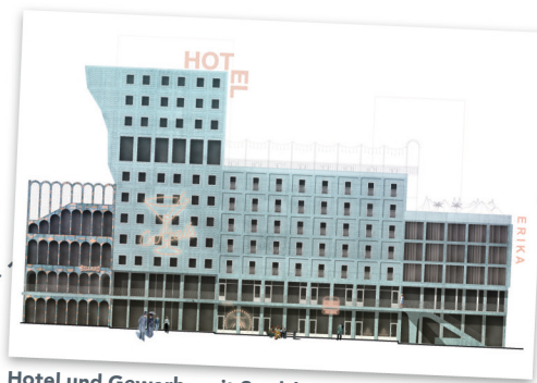
Hotel und Gewerbe mit Stadtbalkon (Spielbudenplatz) NL/BeL

Ist das Gelände fertig, können Sie durch die neue Gasse zwischen den Häusern schlendern und die Vielfalt dort entdecken, auf den Dächern spielen oder auf dem Stadtteilbalkon den Tag genießen.